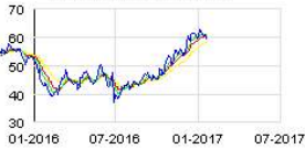
BNP PARIBAS (FR) Historic