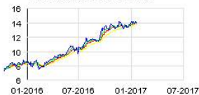
ECONOCOM GROUP Historic