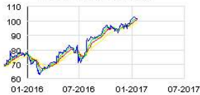
ATOS ORIGIN (FR) Historic

Le fonds Paris-Saclay Seed Fund est constitué de 17 établissements parmi lesquels Polytechnique, HEC, CentraleSupélec ou encore l'ENS Cachan.