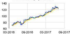
ATOS ORIGIN (FR) Historic

Fonctionnant 6j/7 et 24/24, ce site ID Logistics, qui réalise la prestation logistique pour le compte de Carrefour, emploie près de 200 personnes. Au total, il traitera près de 17 millions de colis par an, soit environ 100.000 palettes.