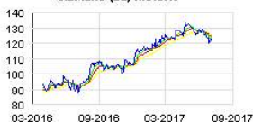
SIEMENS (DE) Historic

Atos est un leader international de la transformation digitale avec environ 100 000 collaborateurs dans 72 pays et un chiffre d'affaires annuel de l'ordre de 12 milliards d'euros. Numéro un européen du Big Data, de la Cybersécurité, des supercalculateurs et de l'environnement de travail connecté, le Groupe fournit des services Cloud, solutions d'infrastructure et gestion de données, applications et plateformes métiers, ainsi que des services transactionnels par l'intermédiaire de Worldline, le leader européen des services de paiement. Grâce à ses technologies de pointe et son expertise digitale & sectorielle, Atos accompagne la transformation digitale de ses clients dans les secteurs Défense, Finance, Santé, Industrie, Médias, Énergie & Utilities, Secteur Public, Distribution, Télécoms, et Transports. Partenaire informatique mondial des Jeux Olympiques et Paralympiques, le Groupe exerce ses activités sous les marques Atos, Atos Consulting, Atos Worldgrid, Bull, Canopy, Unify et Worldline. Atos SE (Societas Europea) est une entreprise cotée sur Euronext Paris et fait partie de l'indice CAC 40.