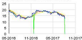
SEAWORLD ENTERTAINMENT Historic

Le groupe pharmaceutique canadien est par ailleurs moins optimiste quant à ses revenus sur l'exercice. Ceux-ci sont en effet attendus entre 8,7 et 8,9 milliards de dollars, contre de 8,9 à 9,1 milliards anticipés auparavant.