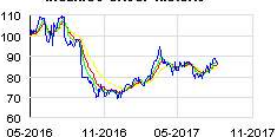
INGENICO GROUP Historic

Jugée au bord de la faillite, Banco Popular était jusqu'à présent la sixième banque espagnole. Son sauvetage avait été organisé en juin dernier par la Banque centrale européenne (BCE) et le Conseil de résolution unique (CRU), nouvel organisme de l'Union européenne dédié à la liquidation des banques défaillantes.