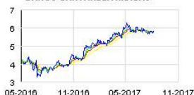
BANCO SANTANDER Historic

Le chiffre d'affaires a, lui, beaucoup moins progressé qu'attendu. Il est en effet passé de 371,1 à 373,8 millions de dollars, contre 394,8 millions prévus par le marché.