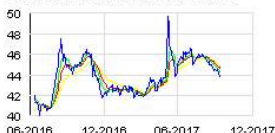
IMMOBILIERE DASSAULT SA Historic

Grâce à sa bonne santé financière, Immobilière Dassault pourra mener avec sérénité ce projet, tout en restant attentive aux opportunités d'acquisitions pour continuer à faire croître la valeur de son patrimoine de grande qualité.