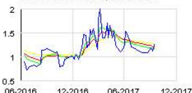
TONNA ELECTRONIQUE Historic