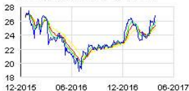
LAGARDERE GROUP (FR) Historic