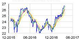
UNION FIN.FRANCE Historic