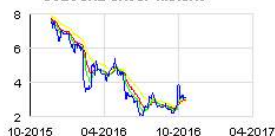
SOLOCAL GROUP Historic

Ces 2 opérations ont permis à Wendel de poursuivre la diminution du coût moyen de sa dette obligataire à moins de 3% en moyenne, contre 3,5% à fin août, tout en réduisant son endettement brut à 3.379 millions d'euros. La maturité moyenne de la dette de Wendel sera de 4,7 ans à la date de règlement-livraison.