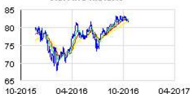
VISA INC Historic

RegroupementPPLocal décrit également une société 'très significativement bénéficiaire' malgré les charges financières imposées par les créanciers et qui dispose d'une trésorerie d'exploitation 'largement excédentaire'.