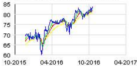
THALES / EX THOMSON CSF Historic