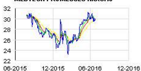
MEDTECH PROMESSES Historic

Enfin, dans l'Hexagone, le centre hospitalier France Hôpital Bicêtre, l'un des hôpitaux de l'assistance publique des Hôpitaux de Paris, s'est porté acquéreur d'un exemplaire du robot ROSA Brain.