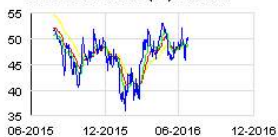
TECHNIP COFLEXIP (FR) Historic

Ce franchissement est intervenu par suite d'une cession d'actions hors marché et sur le marché et d'une diminution du nombre d'actions détenues à titre de collatéral.