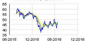
BNP PARIBAS (FR) Historic

Ce franchissement de seuils résulte d'une augmentation du nombre d'actions BNP Paribas détenues à titre de collatéral.