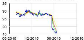
EUTELSAT COMMUNICATION Historic

Oddo estime aussi qu'Eutelsat bénéficie d'une marge de manoeuvre pour baisser ses dépenses d'investissement, notamment pour les deux ans à venir (-25% dès l'exercice 2016/17 contre -10% pour le consensus).