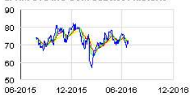
EPAM SYS INC COM USD0.001 Historic

CONTACT: Danielle Ruess-Saltz M: 267.978.7688 danielle_ruess-saltz@epam.com