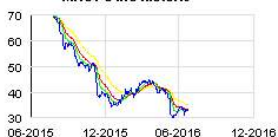
MACY'S INC Historic

En dépit d'un bénéfice par action (BPA) meilleur que prévu au titre du premier trimestre, Macy's a abaissé ses prévisions annuelles le mois dernier en raison de ventes décevantes. Le groupe basé à Cincinnati vise à présent un BPA compris entre 3,15 et 3,4 dollars, contre de 3,8 à 3,9 dollars auparavant, pour des ventes en données comparables attendues en baisse de 3 ou 4% (-1% annoncé précédemment).