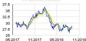
JC DECAUX Historic

Direction de la Communication : Agathe Albertini +33 (0)1 30 79 34 99 - agathe.albertini@jcdecaux.com Relations Investisseurs : Arnaud Courtial +33 (0)1 30 79 79 93 - arnaud.courtial@jcdecaux.com