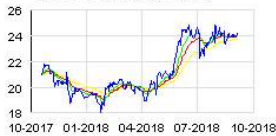
SMCP PROMESSES Historic

celia.deverlange@smcp.com pauline.roubin@smcp.com