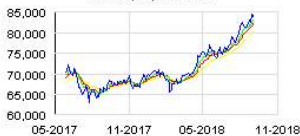
LINDT (CH) Historic

Nombre total de droits de vote et d'actions composant le capital (Article L.233-8 II du Code de commerce et article 223-16 du Règlement Général de l'Autorité des marchés financiers)