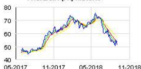
FAURECIA (FR) Historic